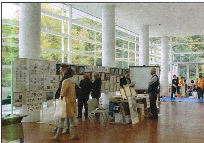
オーガニックフェスティバル (会場 かずさアカデミアホール) 平成 2 8 年 1 1 月 1 6 日