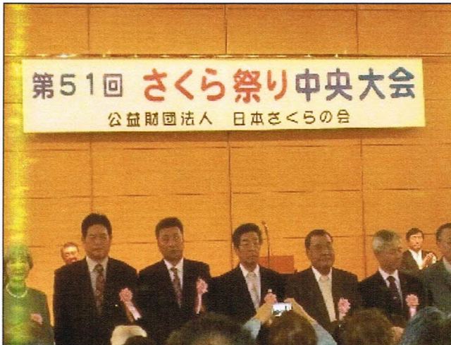
第 5 1 回さくらまつり中央大会「さくら功労者」受賞 (会場 憲政記念館) 平成 2 8 年 4 月 1 3 日