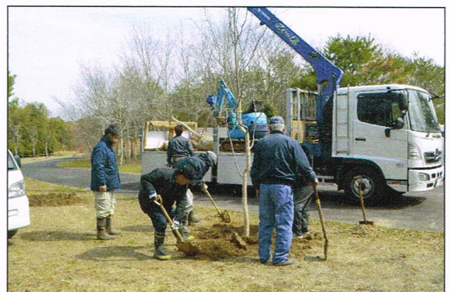
鎌足桜「バイオ苗木」の移植と看板設置 (鎌足さくら公園) 平成28年3月12日