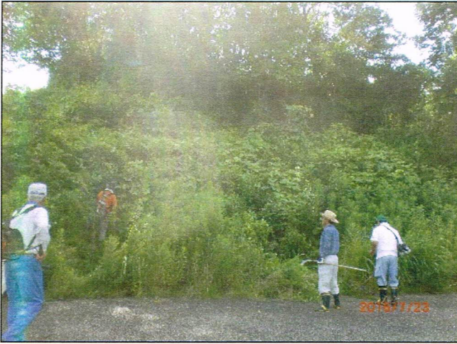
植樹した鎌足桜苗木周辺の草刈り共同作業 (鎌足さくら公園内矢那川ダム側) 平成28年7月23日