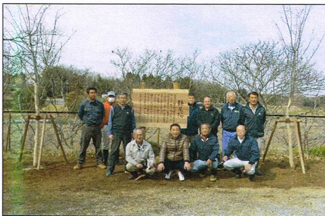
鎌足桜「バイオ苗木」の移植と看板設置 (鎌足公民館) 平成28年3月12日