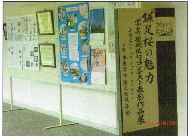
写真と短歌・俳句コンテスト表彰作品の展示 (会場 かずさアカデミアホールアートギャラリー) 平成 2 8 年 8 月 2 8 日～9 月 9 日