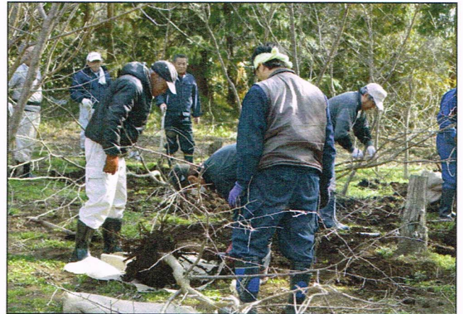
一粒舎との苗木掘り出し共同作業 (大岩農園) 平成28年2月20日