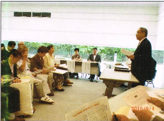
「鎌足桜の魅力」写真と短歌・俳句コンテスト表彰式(会 場 かずさアカデミアホール) 平成 2 8 年 9 月 4 日