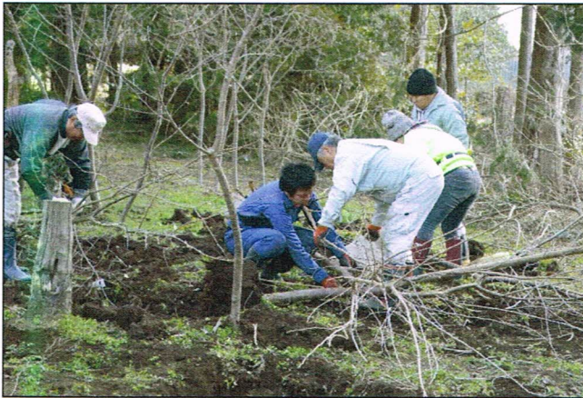
一粒舎との苗木掘り出し共同作業 (大岩農園) 平成28年2月20日