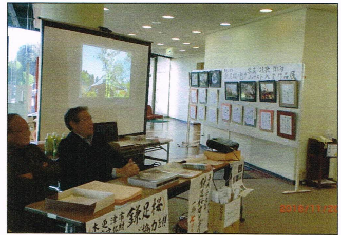
生涯学習フェスティバル (会場 木更津市民会館) 平成 2 8 年 1 1 月 2 0 日