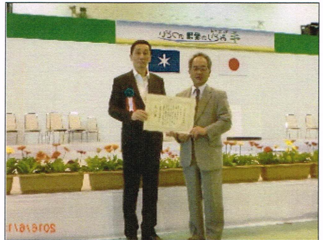
第 2 7 回全国「みどりの愛護」のつどい 千葉県都市緑化功労者知事表彰受賞 (会場 千葉県立柏の葉公園) 平成 2 8 年 6 月 1 2 日