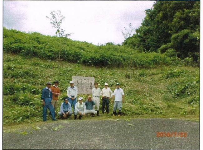
植樹した鎌足桜苗木周辺の草刈り共同作業 (鎌足さくら公園内矢那川ダム側) 平成28年7月23日