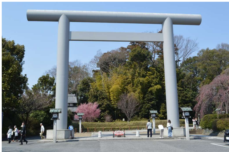
大鳥居正面の鎌足桜