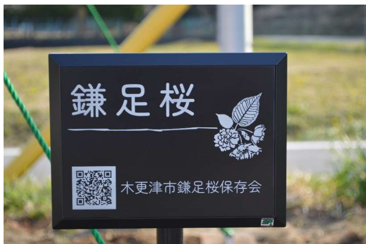
公民館の鎌足桜植え替えました。(鎌足桜看板を新しく作成しました)